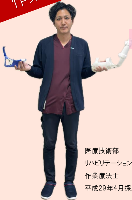
医療技術部 リハビリテーション部門 作業療法士 平成29年4月採用