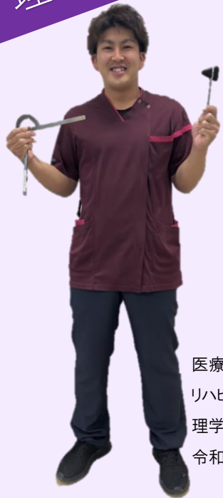
医療技術部 リハビリテーション部門 理学療法士 令和2年4月採用