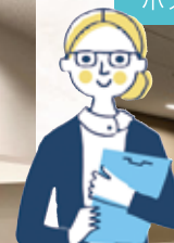
ホスピタルアート1階花の和